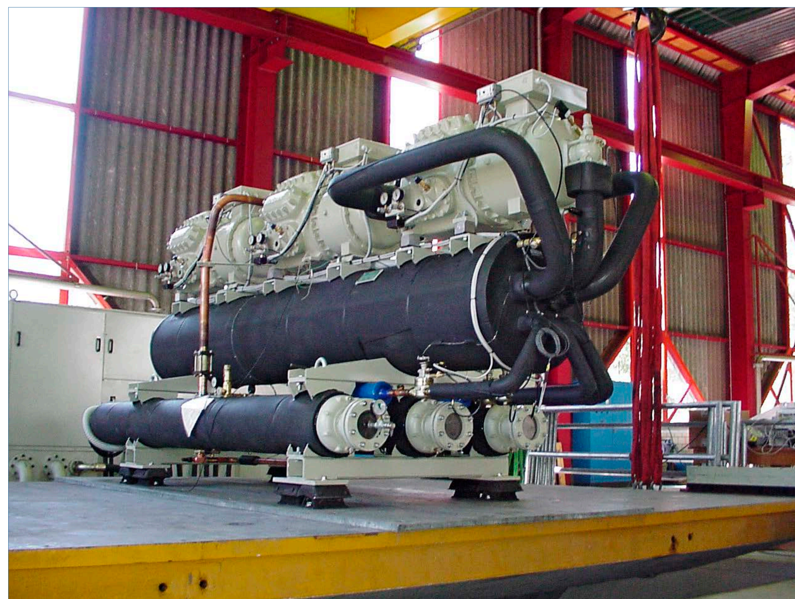
Prüfobjekt (Kältemaschine), Z-Achse