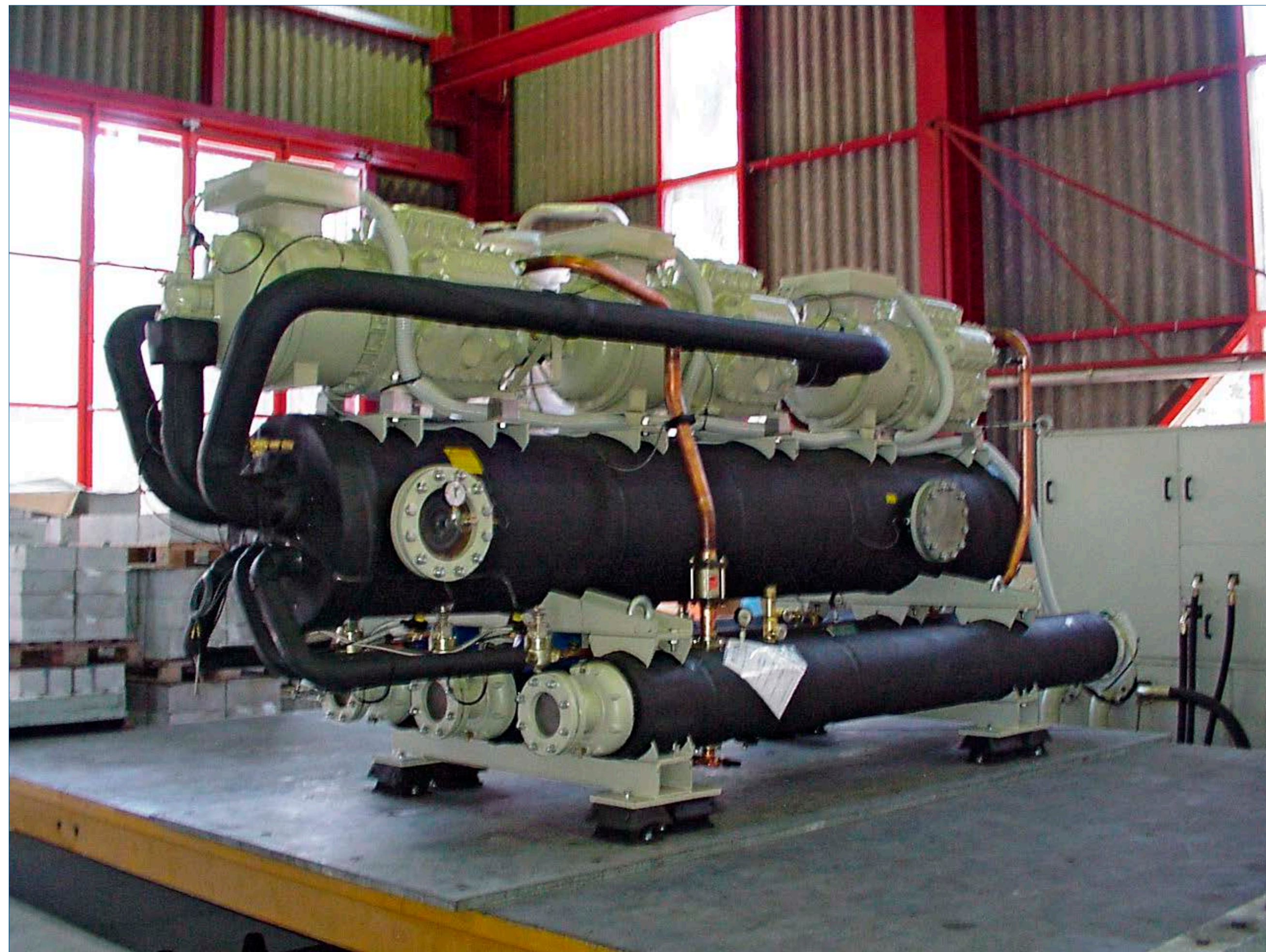
Prüfobjekt (Kältemaschine), Z-Achse